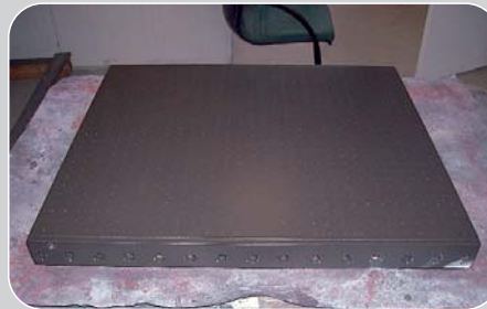
Diese Abbildung zeigt die fertig gebrannte Platte, welche vorher noch mit zwei Schichten (Midcode/Topcode) naß-in-naß und bei einer Temperatur von ca. 450 grad gebrannt ist.