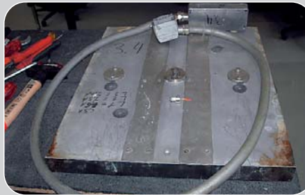
Hier zeigen wir am Beispiel einer „Sandwich-Vorheizung“ wie eine Überholung bei TEFTEC aussieht. Das stark reparaturbedürftige Werkzeug mit verschlissener Beschichtung.